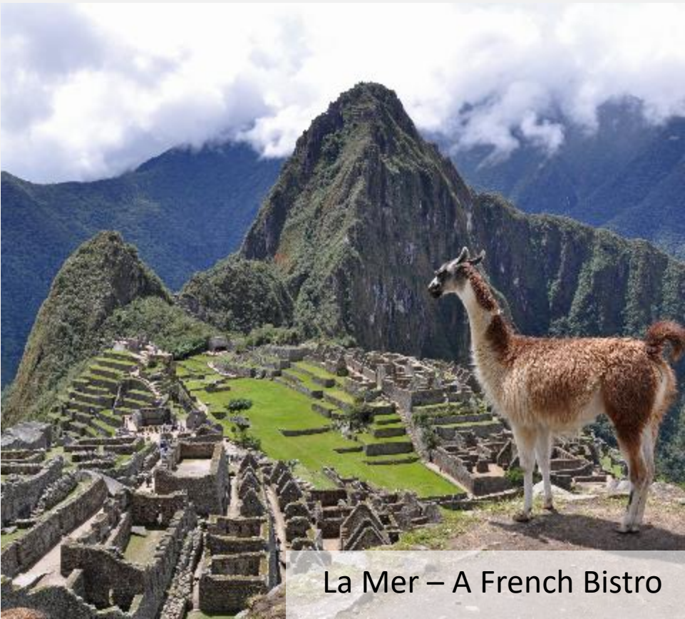
La Mer – A French Bistro